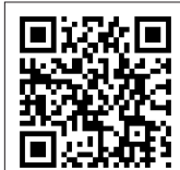
スマートフォン版HP

ようこそお越し下さいました。 伊勢は二千年の昔から、 神様がご鎮座されるところです。 ここに住む私たちは、暮らしのすべてが神様のおかげと 感謝しております。 おかげ横丁は、そんな想いから誕生しました。 江戸時代のおかげ参りの頃の伊勢の様子を再現した町で、 じっくりと見ていただきたいものがたくさんございます。 どうぞゆっくりお過ごし下さい。